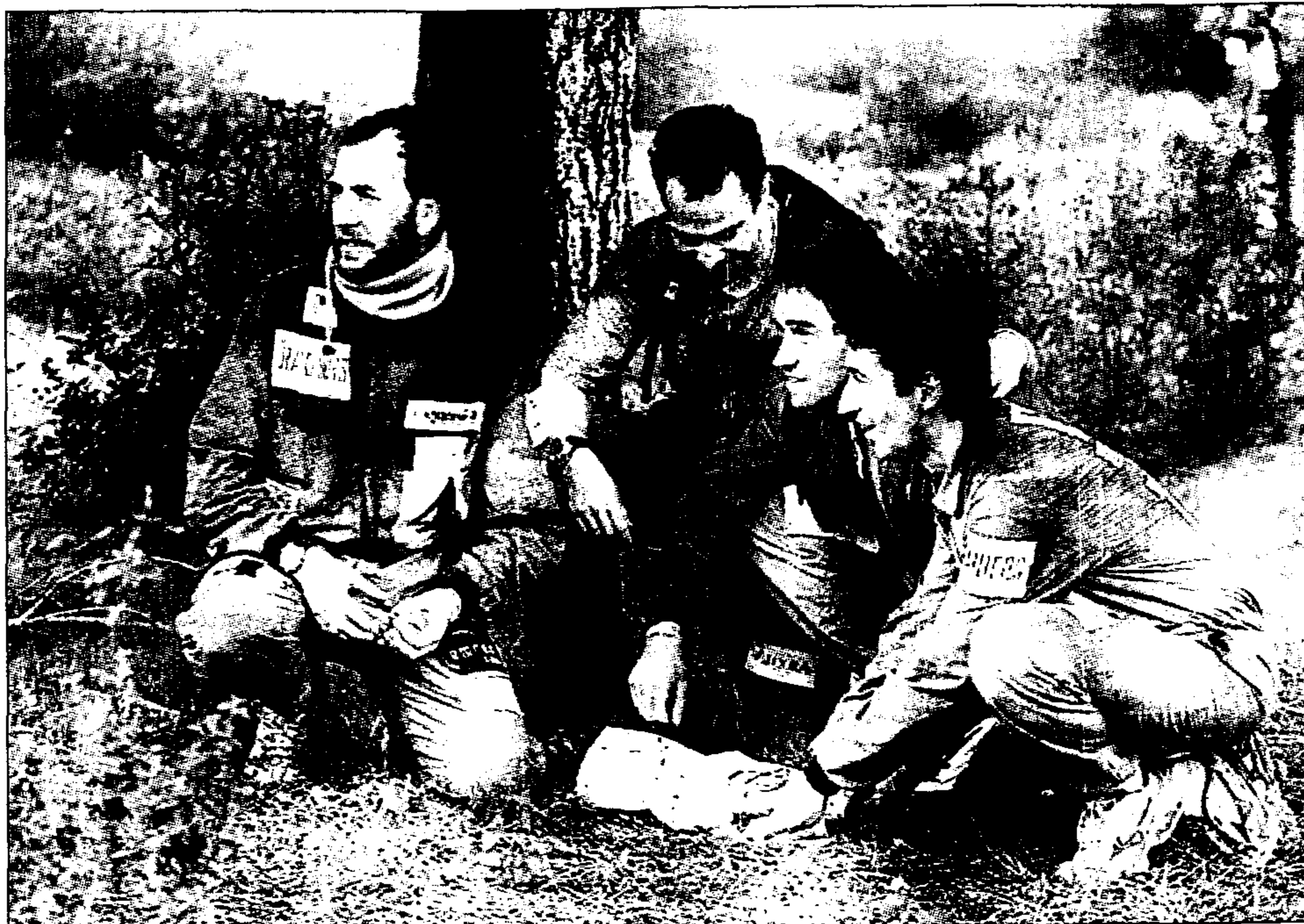
Los empleados que participan en Raiders se lanzan al deporte de aventura siempre en defensa de los colores de su empresa.

Para lograr el éxito deberán confiar y apoyarse en sus compañeros. Cada prueba, cada nuevo desafío, sirve para que los participantes aprendan y se demuestren a ellos mismos lo valioso de formar parte de un equipo cohesionado y con alto rendimiento.