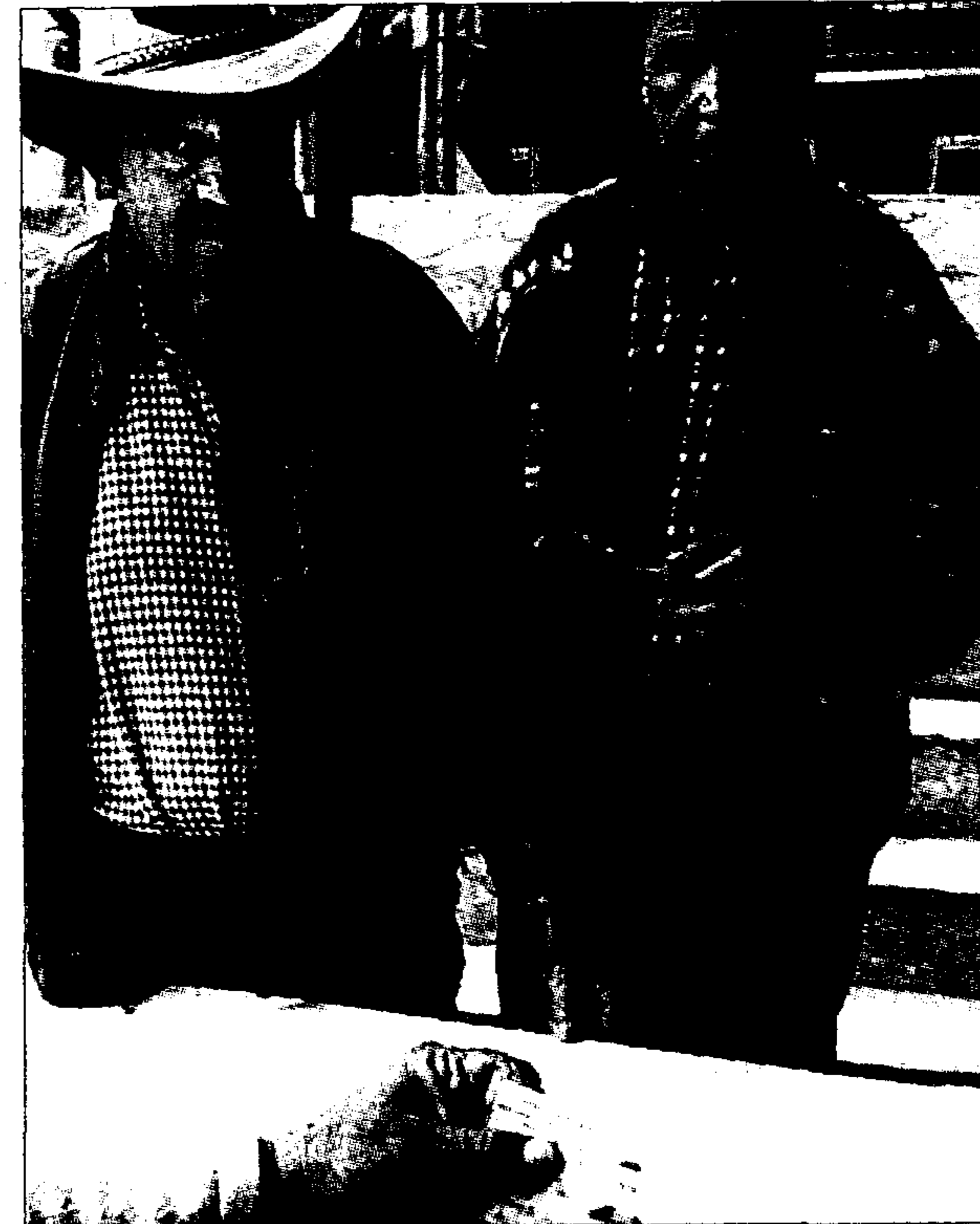
La población indígena es una de las más favorecidas por la acción social de las empresas españolas.

6. Facilitarán el diálogo entre escuelas, empresas, gobiernos y otros grupos de interés para concienciarlos sobre RSC.